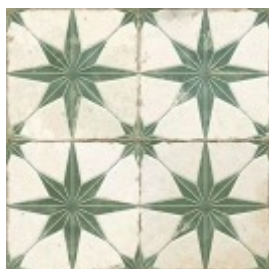
FS ROCKSTAR 45X45