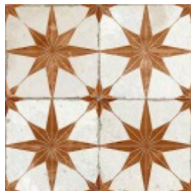
FS STAR ARA 45X45