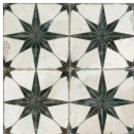
FS STAR WHITE 45X45