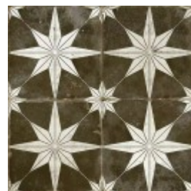
FS STAR SKY 45X45