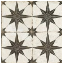
FS STAR NIGHT 45X45