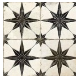
FS STAR LT WHITE 45X45