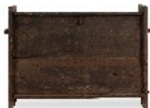
ESPEJO ANTIGUO 61X9XH124