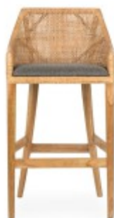
RIVE CRETA 47X53XH77