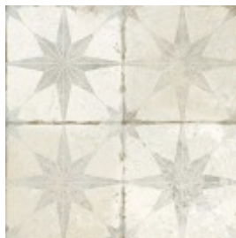
FS STAR BLUE 45X45