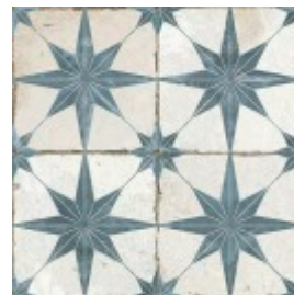
FS STAR SAGE 45X45