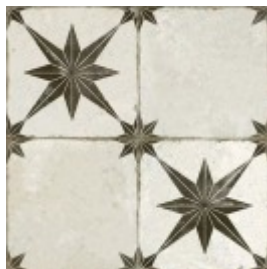
FS STAR LT BLACK 45X45